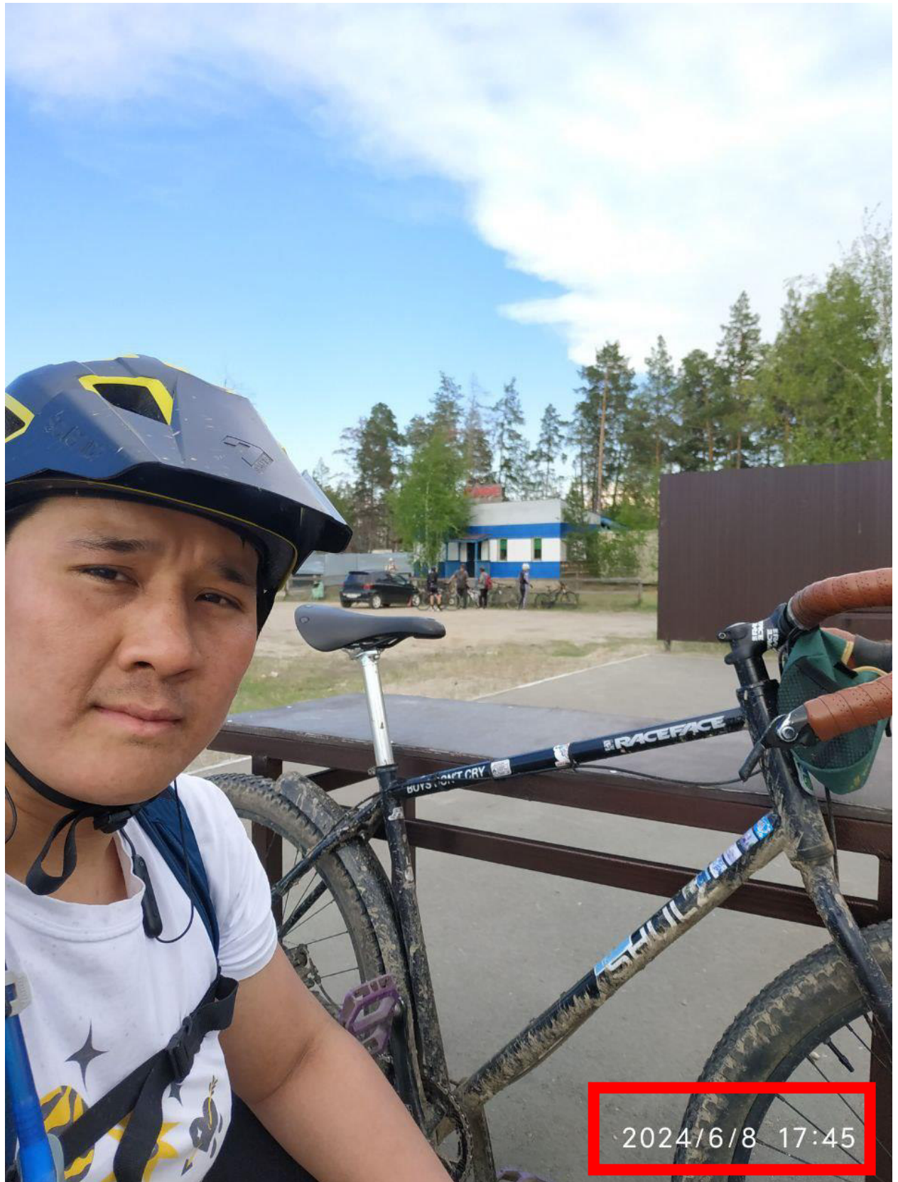
Фото должно быть с датой и временем!