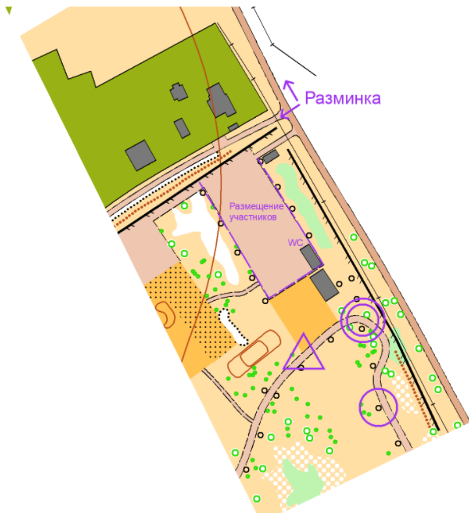
Схема арены соревнований

Местность сильнопересеченная, овражно-лощинного типа с перепадами высот на склоне до 10 метров. Дорожная сеть развита хорошо, представляет собой сетку действующих лыжных трасс Лес преимущественно хвойный, разной степени проходимости.