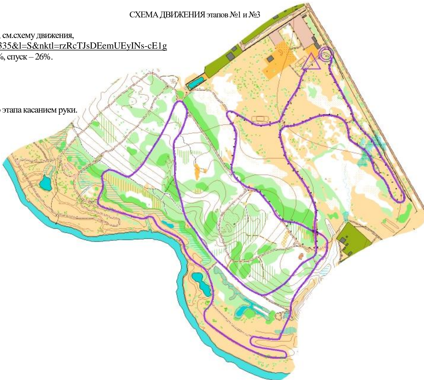
СХЕМА ДВИЖЕНИЯ этапов №1 и №3

Переход на второй круг в зоне старта-финиша.